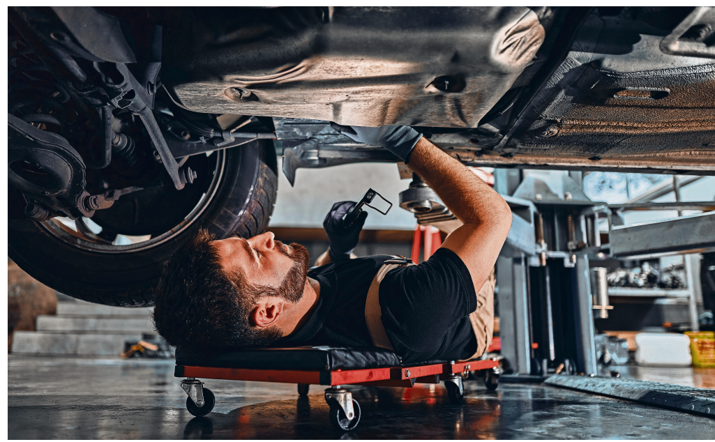
Der Beruf des Kfz-Mechatronikers ändert sich stetig - aktuell eröffnet das Thema Elektromobilität neue Möglichkeiten und stellt die Branche vor neue Herausforderungen.

Nach der Ausbildung bieten sich vielfältige Weiterbildungsmöglichkeiten. Der Weg zum Meister ist eine naheliegende Option, die nicht nur mit einem höheren Gehalt, sondern auch