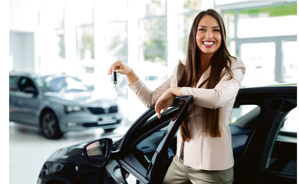
Beruf Automobilkauffrau wird immer beliebter. Eine Ausbildung im Kfz-Gewerbe eröffnet vielfältige Berufsbilder und Karriereoptionen.

Tatsächlich stehen Berufe rund um Fahrzeuge und Mobilität hoch im Kurs, berichtet das Deutsche Kfz-Gewerbe. Alleine 2022 haben sich mehr als 25.000 junge Menschen für einen KarrierEinstieg in der Kraftfahrzeugbranche entschieden. Bei Männern liegt das Berufsbild Kfz-Mechatroniker auf Platz 1 der beliebtesten Ausbildungsberufe, Frauen zieht es verstärkt zur Automobilkauffrau –sie gehört zu den 10 begehrtesten Berufen. Gründe dafür gibt es genug: Die Branche bietet eine Vielzahl von zukunftssicheren Jobprofilen und Aufstiegsmög-