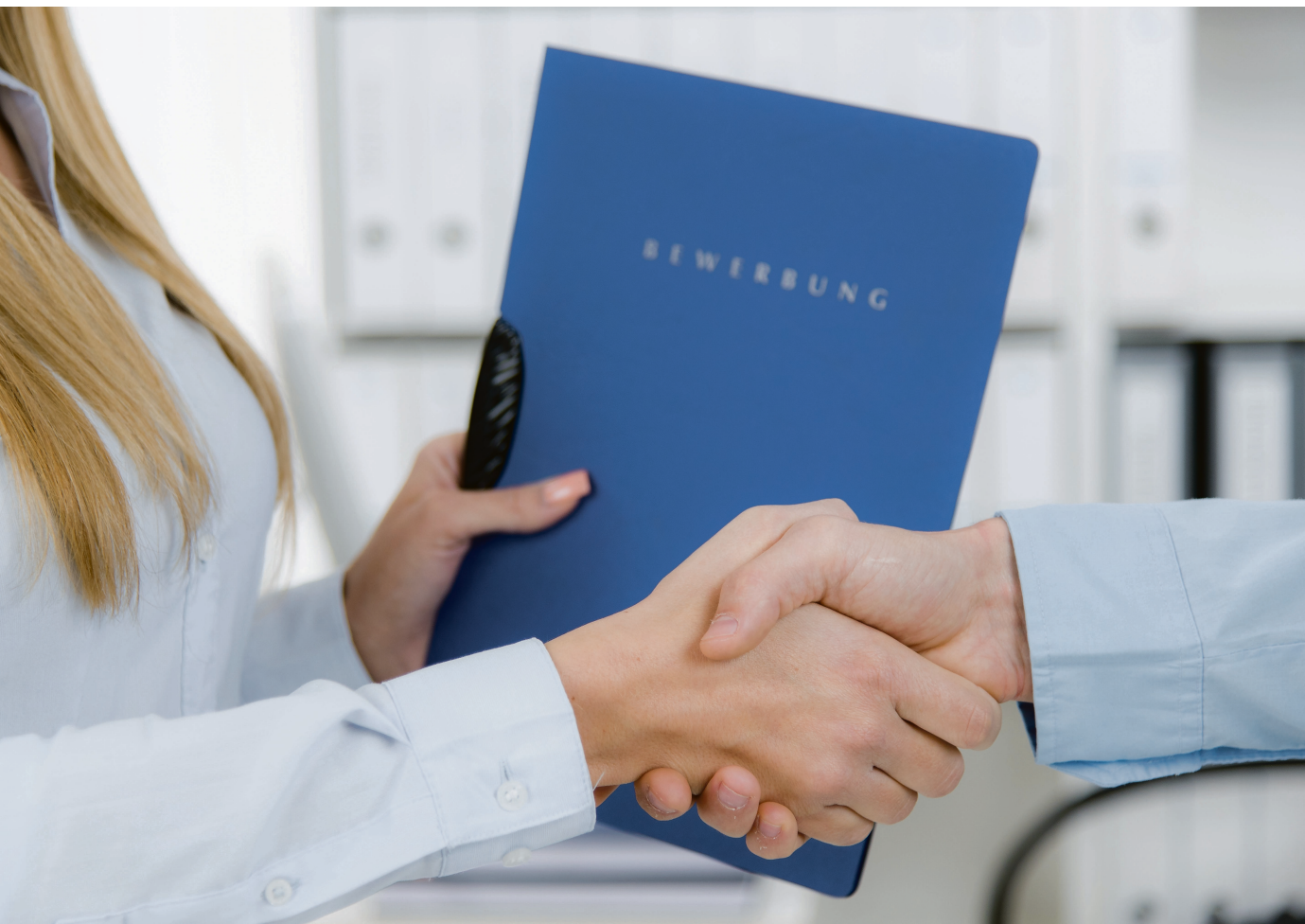
Die Bewerbungsmappe gehört der Vergangenheit an - was nicht heißt, dass man sich bei einer digitalen Bewerbung weniger Mühe geben sollte.

Der erste Schritt zum Traumjob ist die Bewerbung. Doch wie geht man dabei am besten vor? Viele Unternehmen bevorzugen heute Online-Bewerbungen. Aber was bedeutet das für den Bewerbungsprozess und welche traditionellen Regeln sind überholt?